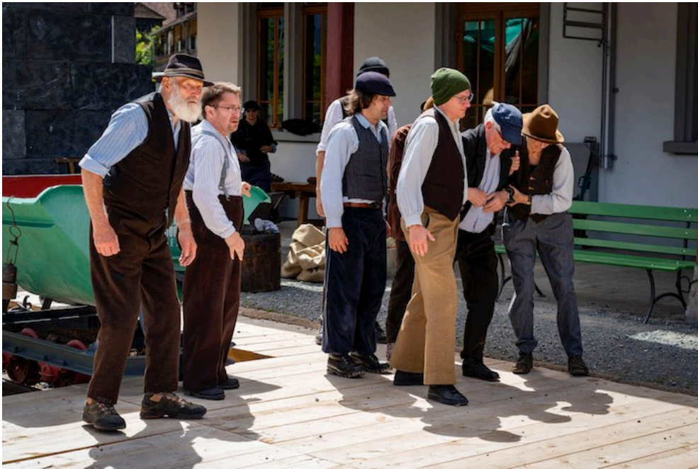
Die Proben sahen vielversprechend aus.

Auf eindrückliche Weise werden in den einzelnen Szenen die beiden Welten des 20. Jahrhunderts im Frutigtal dargestellt: hier die ärmliche Talbevölkerung, dort die reichen Gäste und dazwischen Lesley und Erika, welche durch das Stück führen und die berührende Geschichte des Tunnelbaus und der beiden Liebenden Belinda und Daniel erzählen.