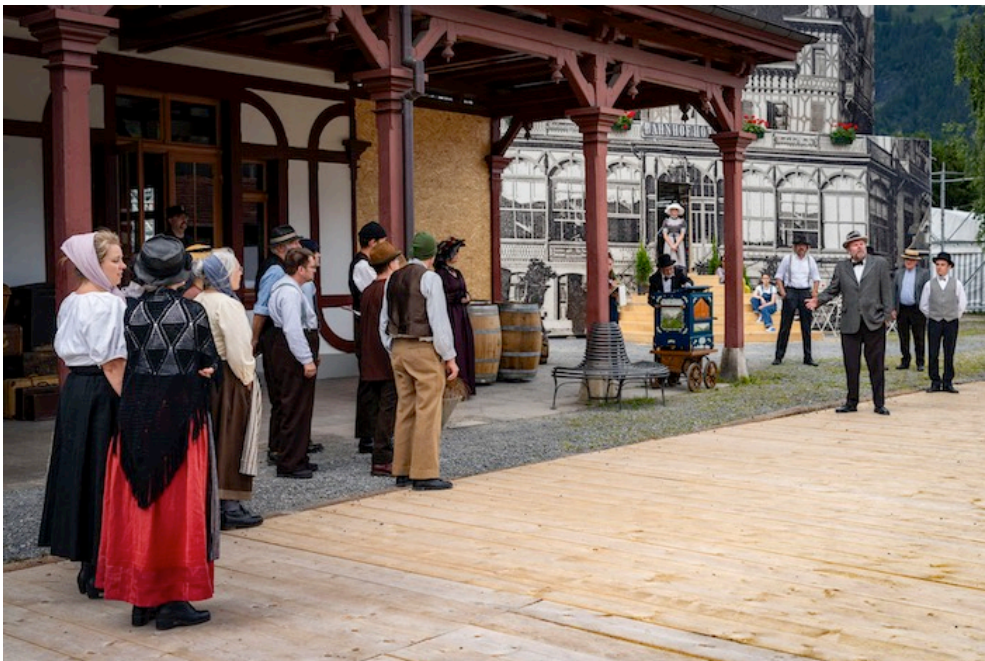
Der historische Bahnhof Frutigen wird zur Kulisse.

Vor der Kulisse des historischen Bahnhofs Frutigen fand am vergangenen Wochenende das zweite Probe-Weekend statt mit allen Schauspielerinnen und Schauspielern des Freilichtspiels «Lötschberg – ein Tal im Aufbruch». Die Premiere findet am 3. Juli statt, weitere Aufführungen gibt es bis am 10. August.