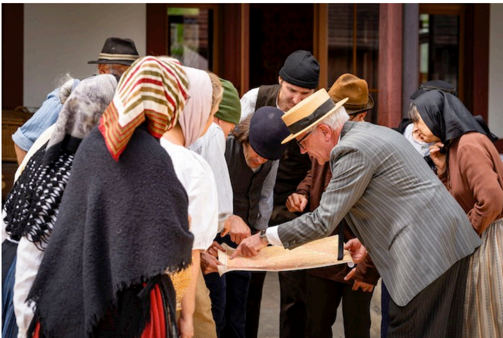
Bis zur Premiere wird der Ablauf sitzen.