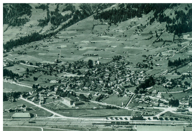
Bild von Mitte der 1930er-Jahre: Rechts unten befindet sich das Seeberger-Areal. Der «Loki-Schopf» scheint gerade im Bau zu sein.

des schweizerischen Eisenbahnnetzes ab 1916 liess den Strombedarf im Land in die Höhe schnellen.