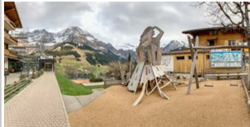
Für das Parkhausareal in Adelboden werden neue Ideen gesucht.