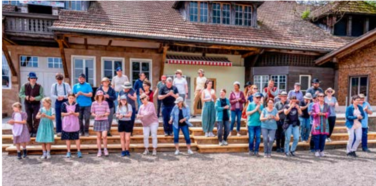
Schritt und Takt müssen stimmen – grosse Probe noch ohne Kostüme.