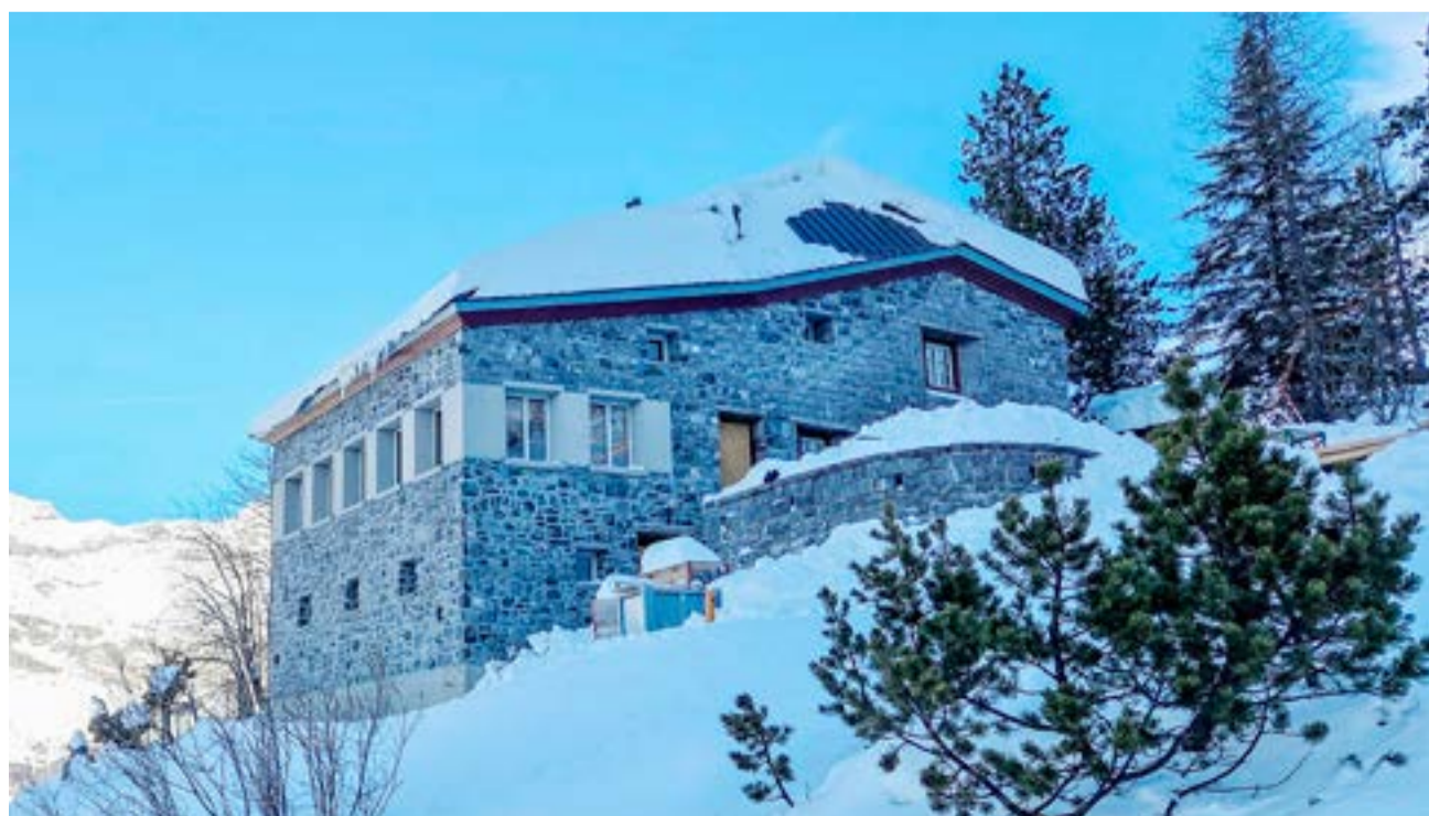
Die Doldenhornhütte im Winter: Ab Auffahrt ist sie wieder offen – nach einem Jahr Umbauzeit.

Infos zur Erneuerung der Doldenhornhütte unter www.erneuerung-doldenhornhuetten.ch