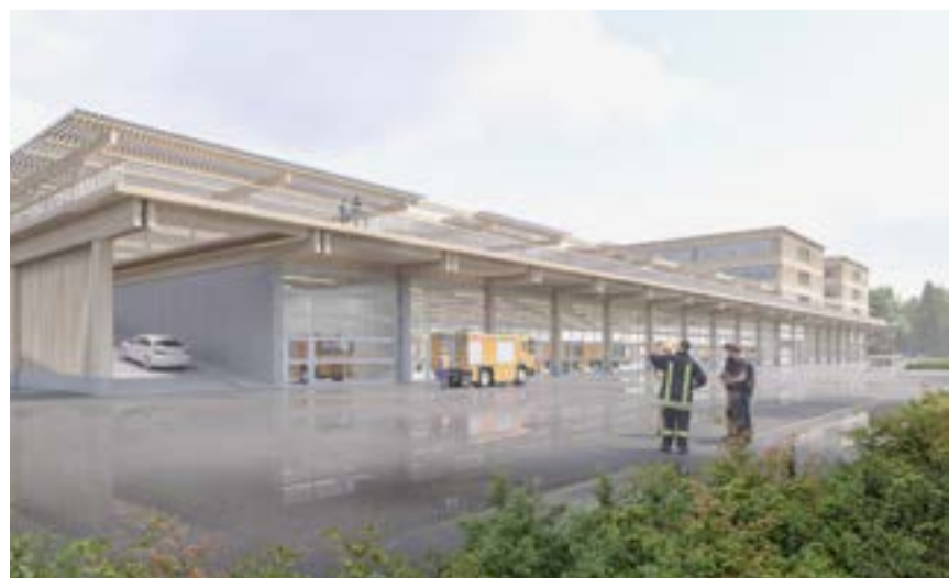
Der Werkhof an der A6 in Gesigen soll nach dieser Visualisierung gestaltet werden.