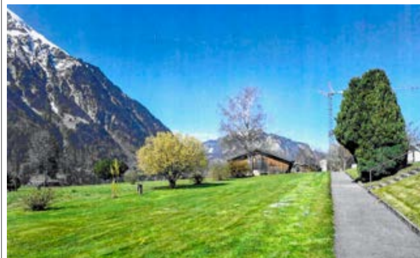
Der Bereich für die neue Art der Sargbestattung in Aeschi.