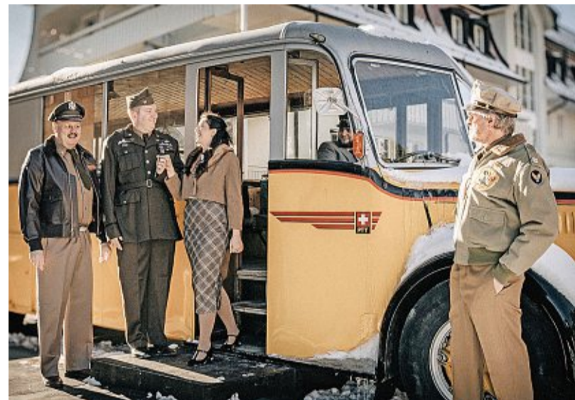
Die internierten Soldaten brachten neuen Swing nach Adelboden.

— Aufstieg und Fall eines Grimselwirts: Landschaftstheater Ballenberg Peter Zybach: Diesen Namen kannte Mitte des 19. Jahrhun-